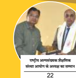
राष्ट्रीय अल्पसंख्यक शैक्षणिक संस्था आयोग के अध्यक्ष का सम्मान 22