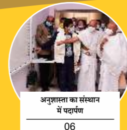
अनुशास्ता का संस्थान में पदार्पण 06