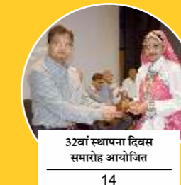
32वां स्थापना दिवस समारोह आयोजित 14