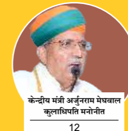
केन्द्रीय मंत्री अर्जुनराम मेघवाल कुलाधिपति मनोनीत 12